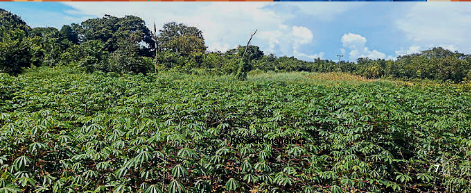
Roça de mandioca